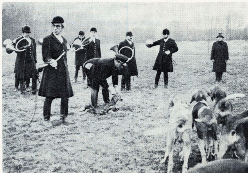
Bois de Charroux. 10 mars 1974.

Après la messe de Saint-Hubert sonnée au Grand-Rond-Point par le Rallye Cor Saint-Hubert de Tusson, un brocard superbe est signalé coupant la ligne au baron et rentrant en direction de la route de Chef-Boutonne. Les chiens prennent la voie vers 12 h 15 et lancent vers 12 h 30 dans les Claches. L'animal saute la ligne de Ré, coupe la ligne