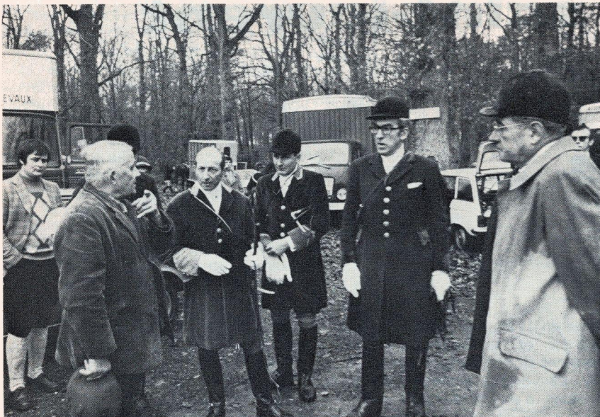
Forêt de Mareuil, Saint-Hubert 1974. Le rapport.